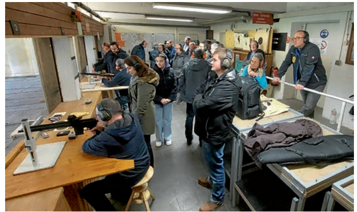
Neujahrsschießen auf dem 50m Stand der SVgg Eppelheim

Die Schützenvereinigung 1912/13 Eppelheim wünscht ihren Mitgliedern und Freunden für das neue Jahr alles Gute, viel Glück und Gesundheit - und allen Schützinnen und Schützen GUT SCHUSS!