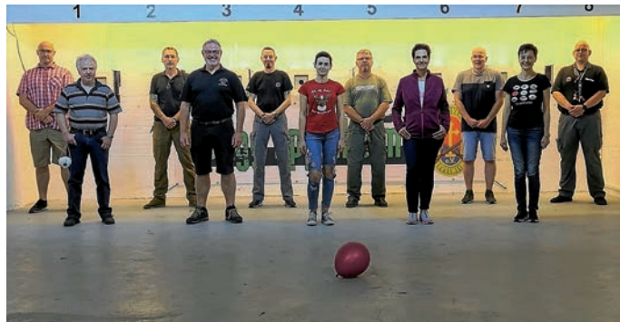
Teilnehmer der Vereinsmeisterschaft

Im Anschluss an den Wettkampf gab es ein gemütliches Beisammensein mit kleiner Siegerehrung im Eppelheimer Schützenhaus. Wir bedanken uns bei den Schützen für die Teilnahme und gratulieren zu diesen hervorragenden Ergebnissen.