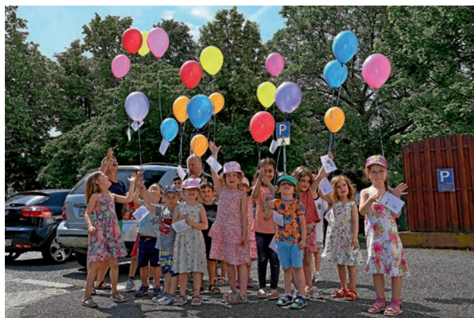
Die Pinguin-Kinder lassen zum Abschluss ihrer Projektwochen mit Helium gefüllte Luftballons steigen und staunen über die Flugeigenschaften der bunten Ballons.