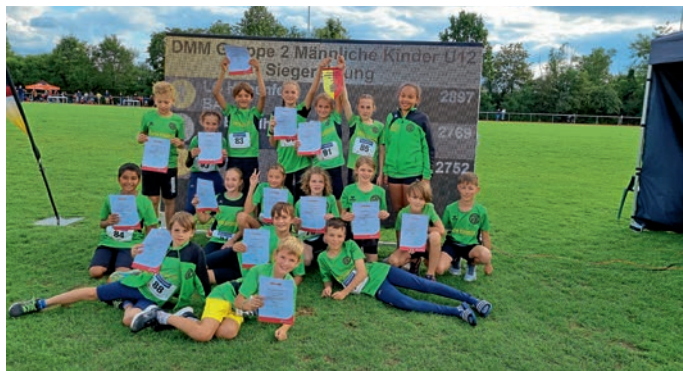
Platz 1 bei den Mädchen, Platz 2 bei den Jungs – die U12 war der erfolgreichste Jahrgang des TVE bei den BSMM.

666 Teilnehmende aus 44 Vereinen und herrliches Wetter garantierten am 23./24.9. den optimalen Rahmen für das Finale der Badischen Mannschaftsmeisterschaften (BSMM), die in diesem Jahr der TVE „daheim“ ausrichtete. Nicht nur der Rahmen konnte sich sehen lassen, auch die Ergebnisse des Eppelheimer Nachwuchses waren einmal mehr bemerkenswert: Platz 1 in der weiblichen Jugend U12, Platz 2 bei den Jungs U12, Platz 1 bei den Jungs U14 (in Startgemeinschaft mit Walldorf), Platz 3 bei den Mädchen U14 sowie jeweils Platz 3 bei den Mädchen und Jungs U16, ebenfalls in Startgemeinschaft mit Walldorf. Damit gehört der TVE zu den erfolgreichsten Vereinen in Baden. Auch wenn bei diesem Wettkampf gute Einzelleistungen nichts helfen, sofern die anderen Mannschaftsmitglieder nicht ebenfalls „abliefern“, gab es doch Zeiten, Weiten und Höhen, die Erwähnung finden sollten: 1,60 Meter im Hochsprung von Timo Sillmann (U14), 10,04 Sekunden bei den 60 Meter Hürden von Jan Emmerich (U14) sowie 44,10 Meter im Speerwurf von Marlene Seeling (U16) sind ebenso außergewöhnlich wie die 41,5 Meter beim Schlagballwurf von Max Schmalbach (U12). Gratulation an alle Sportlerinnen und Sportler - und Dank an alle Helfenden, ohne die wir solche Veranstaltungen nicht ausrichten könnten!