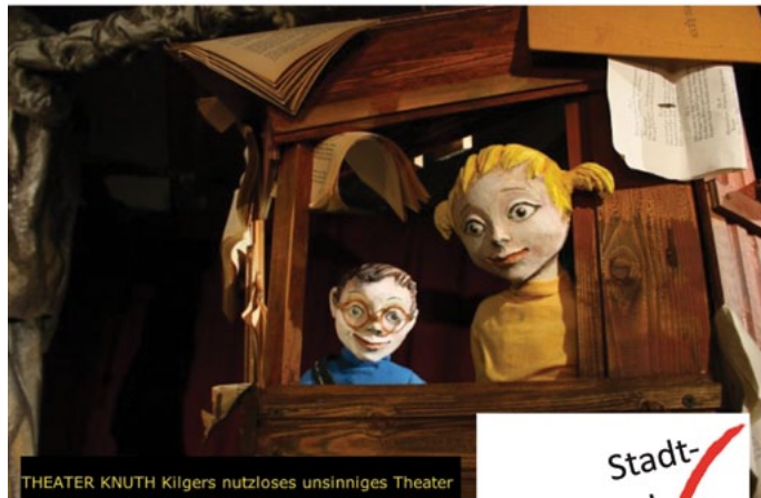
THEATER KNUTH Kilgers nutzloses unsinniges Theater

Vorverkauf ab 18. April in der Stadtbibliothek Kinder 2,50 EUR Erw. 3,50 EUR Fam. 9,00 EUR (1 Erw., 3 Kinder)