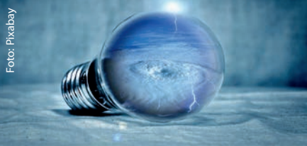
Video von Bürgermeisterin Patricia Rebmann zum Energiesparen www.eppelheim.de