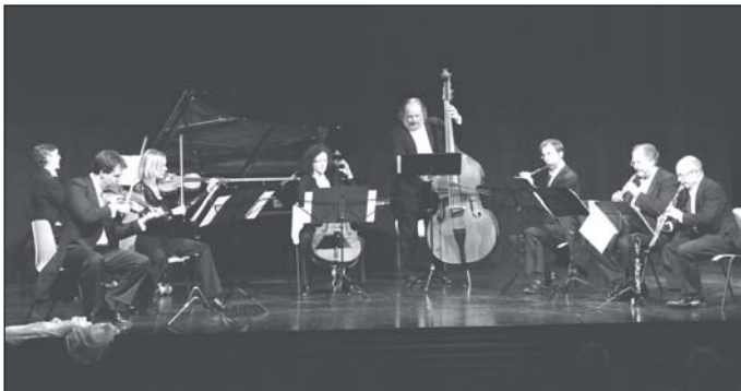
Belohnt wurden die Künstler durch langanhaltenden Beifall und der Forderung nach zwei Zugaben.