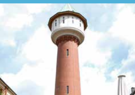
Aus dem Vereinsleben