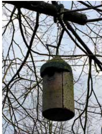
Ein Nistkasten, wie er im Friedhof zu sehen ist.

So einfach kann Naturschutz sein: Nisthilfen sind sinnvoll, wo Naturhöhlen fehlen, weil morsche Bäume oder weil geeignete Brutnischen an Gebäuden fehlen. Im Februar ist noch ausreichend Zeit, Nistkästen zu reparieren oder neue Nisthilfen im Garten anzubringen, bevor im März bereits die Brutzeit vieler höhlenbrütender Singvögel beginnt. Hängen Sie Nistkästen in zwei bis drei Meter Höhe auf und richten Sie idealerweise das Einflugloch Richtung Osten oder Südosten aus. Zur Befestigung können vorzugsweise feste Drahtbügel verwendet werden, die den Baum nicht beschädigen. Damit kein Regen eindringen kann, sollte ein Nistkasten ruhig ein wenig nach vorne geneigt überhängen.