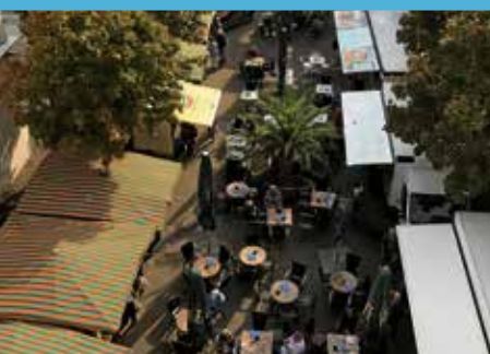
Wochenmarkt am Mittwoch