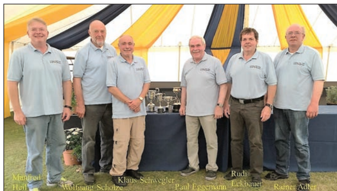
Der Erfolg der deutschen Mannschaft ist mit 4 Challenge Cups, die

Vom BDMP wurde eine 6 Mann starke F-Class Open Mannschaft entsandt. Die eingesetzten Kaliber waren 1x7mm WSM, 1x.284, und 4x wurde erstmals mit Gewehren im Kaliber .300 WSM geschossen.