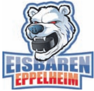
Logo: Eisbären Eppelheim

Mit Drewniak wurde bereits im Vormonat der neue Mann im Bereich Marketing und Öffentlichkeitsarbeit vorgestellt und die Neuerungen lassen dabei nicht lange auf sich warten. Pünktlich zu Saisonbeginn werden die Eisbären einen neuen Internetauftritt bekommen, der die erste Mannschaft und den Stammverein wieder vereint.