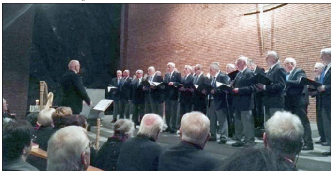
Der Männerchor beim Auftritt in Hofheim