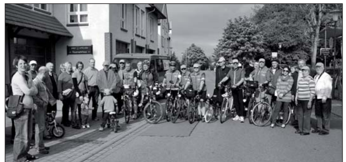
Die Radlergruppe bei der Verabschiedung vor dem Feuerwehrhaus