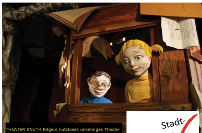
THEATER KNUTH Kilgers nutzloses unsinniges Theater

Das magische Baumhaus für Menschen ab 6 Jahren