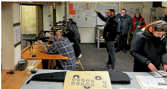
Wettkampf auf dem 50-Meter-Stand der SVgg Eppelheim.