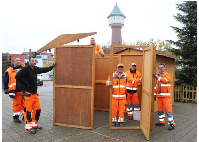
Die Mitarbeiter des Bauhofs haben während der Woche die Hütten rund um die Rudolf-Wild-Halle im Hof der Theodor-Heuss-Schule aufgebaut, damit am Wochenende alles bereit ist fürs Eppelheimer Weihnachtsdorf.

Weihnachtsmärkte sind untrennbar mit der Vorfriede auf die Feiertage verbunden. Leider fielen die beliebten Veranstaltungen in den vergangenen beiden Jahren der Pandemie zum Opfer.