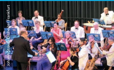
Johann Strauß Orchester Frankfurt