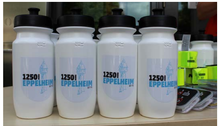
Diese Preise warteten auf die Gewinner des Stadtradelns.