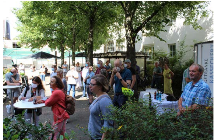
Bei strahlendem Sonnenschein nahmen zahlreiche Radlerinnen und Radler an der Abschlussveranstaltung der Aktion auf dem Rathaus-Vorplatz teil.