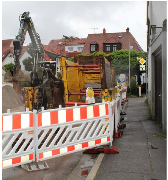
Zu eng für Zweiradfahrer: Der Gehweg ist nur für Fußgänger und Rad fahrende Kinder bis zum Alter von zehn Jahren gedacht.

Eine gegenseitige Rücksichtnahme sowie das Einhalten der Verkehrsregeln ist unerlässlich um Unfälle zu vermeiden