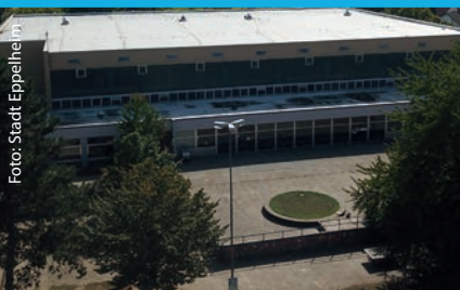
Erinnerungsstücke gesucht