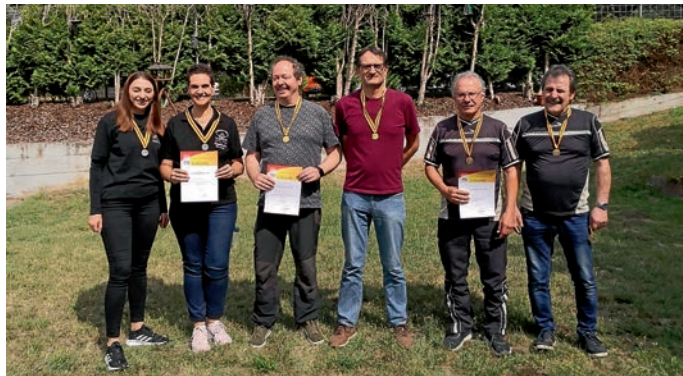
Siegermannschaften der Landemeisterschaft Ordonnanzgewehr aufgelegt 2023

Wir gratulieren unseren Schützinnen und Schützen zu diesem hervorragenden Ergebnis bei der Landesmeisterschaft 2023 und wünschen Ihr weiterhin GUT SCHUSS.