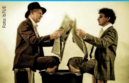
weitere Veranstaltungen in der Rudolf-Wild-Halle