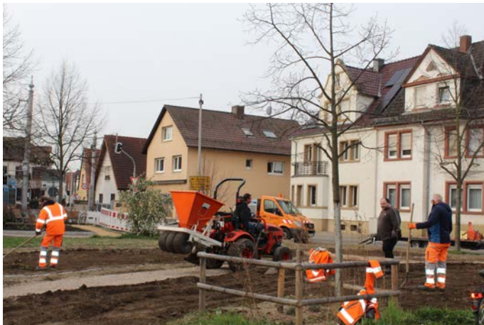
Am vergangenen Dienstag waren die Arbeiten mit den Geräten an der großen Fläche in vollem Gang.

Dammarié-lès-Lys-Platz erfährt ökologische und optische Aufwertung