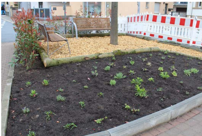
Die schön gestaltete Sitzecke (noch vom Bauzaun begrenzt) lädt jetzt zum Verweilen ein.

Die Arbeiten an der ÖPNV-Endhaltestelle Kirchheimer Straße und die damit verbundene vorübergehende Verlegung des Ein- und Ausstiegs für Fahrgäste haben den Dammarié-lès-Lys-Platz