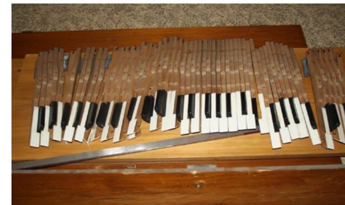
Die ausgebaute Tastatur des Orgelspieltischs

Der Arbeitsplatz des Organisten – noch intakt.