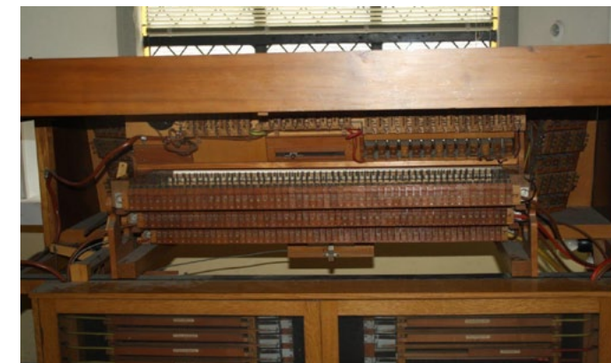
Einblick in das Herzstück des Spieltischs mit sanierungsbedürftiger Verkabelung aus den 50er Jahren.

Wenn Sie die, zum Erhalt der Orgel notwendigen Sanierungsarbeiten unterstützen mögen, freuen wir uns über eine Spende mit dem Verwendungszweck „Orgel“.