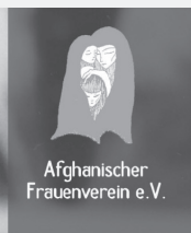
Afghanischer Frauenverein e.V.