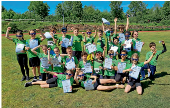
Die U12-Teams des TVE belegten in Dielheim die Plätze 1, 3 und 6.

So kann es weitergehen: Den ersten Wettkampf des Kinderleichtathletik (KiLA)-Cups in dieser Saison, der am vergangenen Wochenende in Dielheim stattfand, beendete der TVE in allen Altersklassen (U8, U10 und U12) jeweils mit einem Sieg. Bei bestem Wettkampfwetter absolvierten die Eppelheimer Nachwuchsathletinnen und -athleten Disziplinen wie Heulerwurf, Zonen-Weitsprung, Team-Biathlon, Hoch-/Weitsprung, (Hürden-)Sprint sowie Mannschafts-Verfolgungslauf. Am Ende schloss die U8 mit Rang 1 von 7 Teams ab und die U10 mit Rang 1, 7 und 9 von 13 Teams – ein fantastisches Ergebnis! Bei der U12 war einmal mehr das „Dielheim-Special“ besonders spannend, nämlich der Verfolgungslauf über 6 x 750 Meter. „Special“ deshalb, weil bei diesem Wettkampf bei der U12 nicht, wie sonst üblich, alle Disziplinen getrennt gewertet werden, sondern sich die Mannschaften in den drei zuerst absolvierten Disziplinen (Hürdensprint, Zonen-Weitsprung und Heulerwurf) einen ihren Wertungen entsprechenden Vorsprung bzw. Abstand für den abschließenden Verfolgungslauf erarbeiten. Im letzten Jahr verpasste die Eppelheimer U12 in Dielheim deswegen knapp den Sieg, in diesem Jahr schafften es am Ende die Seckenheimer, sich zwischen die beiden zuvor erst- und zweitplatzierten TVE-Teams zu schieben, sodass die Eppelheimer am Ende Rang 1, 3 und 6 bei 9 teilnehmenden Teams belegten. Trotz dieses Wermuttröpfchens ein Auftakt nach Maß für den TVE in die Freiluftsaison 2024.