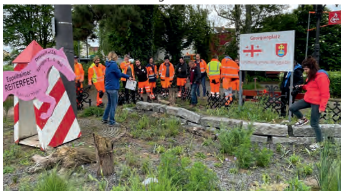
Am Georgienplatz ist die Entwicklung noch nicht so weit fortgeschritten wie vor der Theodor-Heuss-Schule.