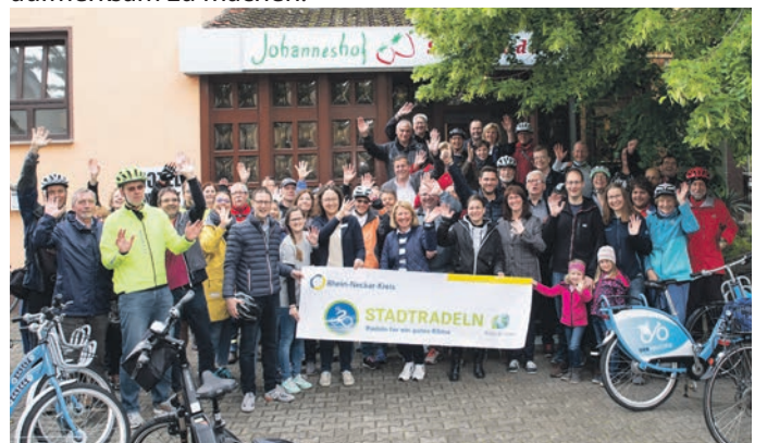
Über 50 Radelnde trafen sich zur gemeinsamen Radtour durch Hockenheim und sammelten bereits erste Kilometer für die Aktion STADTRADELN.