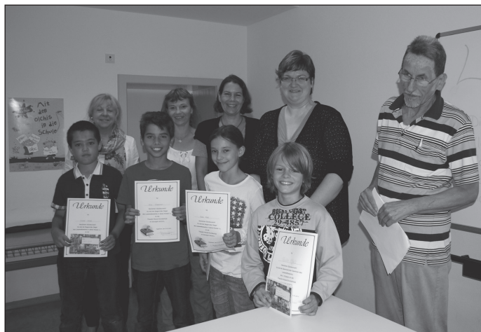
Am Ende der Vorrunde zeigen sich hier die stolzen Sieger der 4. Klassenstufe mit den Jurymitgliedern.

Sowohl die Sieger der einzelnen Klassen als auch die Gewinner der Klassenstufen erhielten als Belohnung für ihre großartigen „Vorlesungen“ Buchgutscheine über 10 Euro, gestiftet vom Freundeskreis der Theodor-Heuss-Grundschule. Angesichts der guten Resonanz bei Lehrerinnen und Kindern ist eine Neuauflage des Wettbewerbs auch im kommenden Jahr geplant und der Freundeskreis übernimmt gerne wieder das Sponsoring.