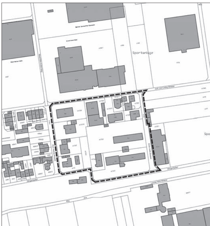
Abgrenzung des Geltungsbereichs – ohne Maßstab

Bebauungsplan „Justus-von-Liebig-Straße – 3. Änderung“ Anlage zum Aufstellungsbeschluss