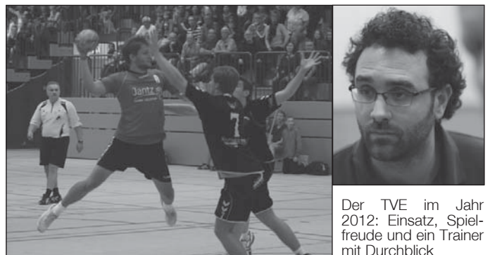
Der TVE im Jahr 2012: Einsatz, Spielfreude und ein Trainer mit Durchblick